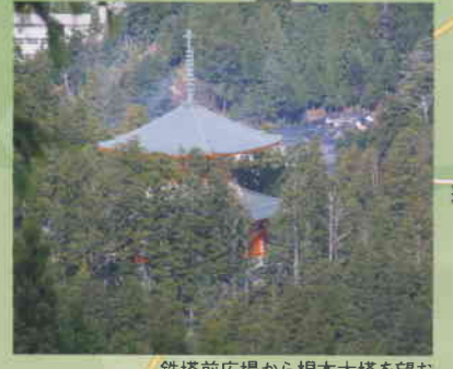
鉄塔前広場から根本大塔を望む