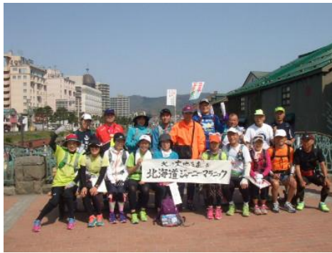
小樽運河 スタート

8:00 東横イン札幌南口出発～車～9:10 小樽運河スタート→約77.5km ……余市ニッカウキスキー……16:30 積丹半島・カムイ岬ゴール～17:30 積丹町・お宿新生着～温泉・岬の湯しゃこたん～18:30 夕食… ※小樽～カムイ岬までの約77.5kmを走るのには時間的に無理なので 小樽運河 9:10 スタート～余市(ニッカウキスキー) 12:00 着 20km 走る。 12:00～13:00 余市ニッカウキスキー見学(すごい人気で大混雑)……車移動して カムイ手前約9km 地点 15:00 スタート～カムイ岬ゴール 16:30 神威岬は絶景! 参加者全員感動! この景色は一生脳裏に残るだろう。